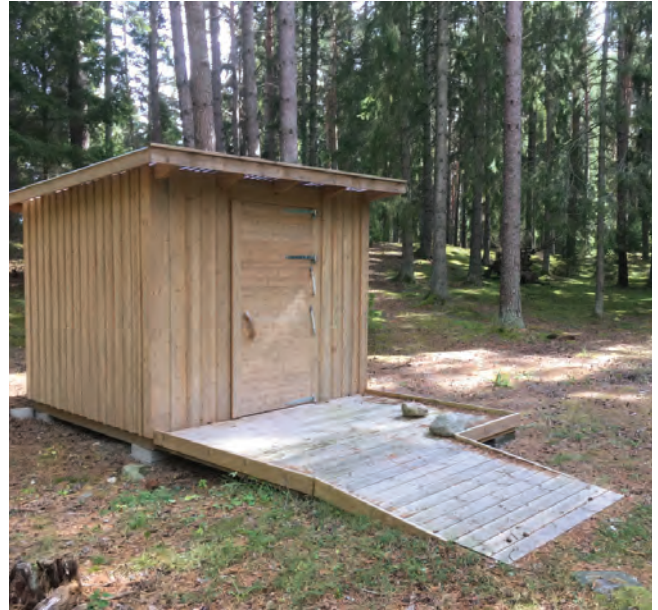
Produktbild: torrtoalett utvändigt

Djup (ytterkant panel): 245 cm Bredd (ytterkant panel): 260 cm (dörrsida) Lägsta höjd invändigt: 190 cm Golv: 28 x 120 mm tryckimpregnerad Klass AB Takbeklädnad: Takplast, ljusinsläpp genom takplaten Målad utvändigt Vägghpanel: 22 x 145 mm med lockläkt Dörr: Högerhängd Platå framför dörr: 250 x 200 cm Rullstolsramp 150 x 170 cm Latrintank 245 liter Invändiga armstöd vid toalettring Kraftig och lätthanterlig stängningsanordning på insida dörr